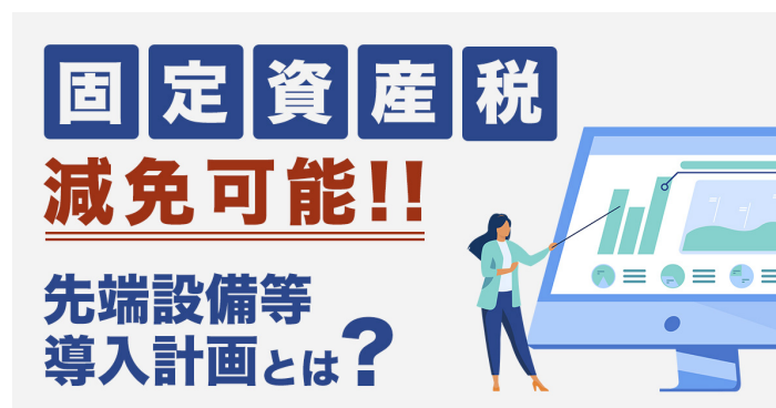
【固定資産税減免可能!先端設備等導入計画とは...