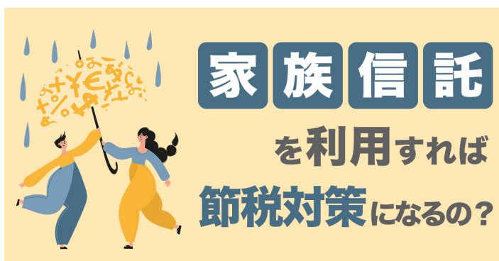
【家族信託は節税対策になる!?!】