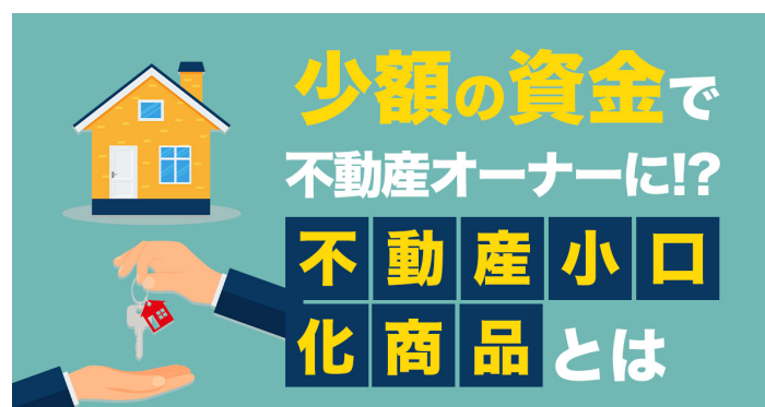
【少額の資金で不動産オーナーに!! 不動産小口...