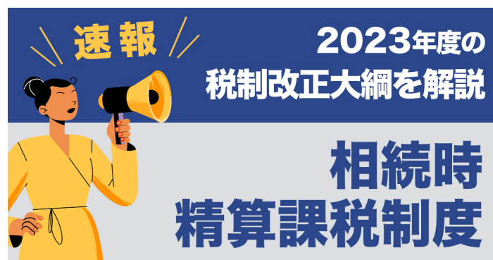
【速報!2023年度の税制改正大綱を解説】