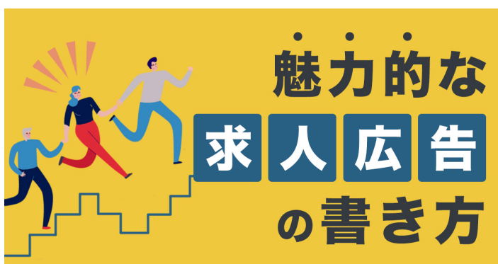
【魅力的な求人広告の書き方】

「税務・財務・会計」「相続・生前対策」「人事・労務」「資産形成」などタイムリーなテーマのアニメーション動画ニュースを配信します。